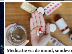
Medicatie via de mond, sondevoeding of voeding via een infuus