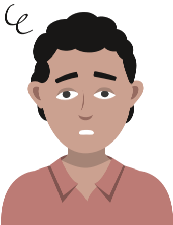
LICHT GEVOEL IN HOOFD