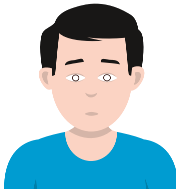
AFWEZIGHEID ONSCERP ZIEN