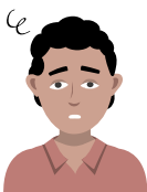
LICHT GEVOEL IN HOOFD