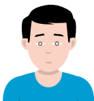
AFWEZIGHEID ONSCHERP ZIEN